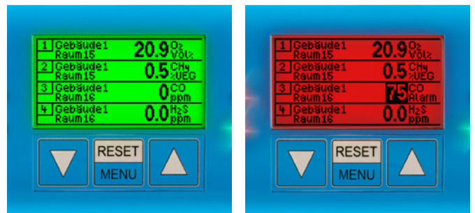
Messwertübersicht im Normal- bzw. im Alarmzustand

Die aktuellen Messwerte aller Transmitter werden kontinuierlich im 2,2"-LC-Display angezeigt. Den Betriebsstatus zeigen die Status-LEDs an. Im Normalbetrieb leuchtet nur die grüne LED. Eine gelbe LED weist auf Fehlfunktionen oder Servicearbeiten hin. Im Falle eines Alarms wechselt die Hintergrundfarbe des Displays von Grün zu Rot und nur noch die Messwerte der Messstellen, an denen Grenzwerte über- oder unterschritten wurden, werden dargestellt. Rote LEDs weisen auf die Alarmstufe hin. Zusätzlich ertönt ein akustisches Warnsignal.