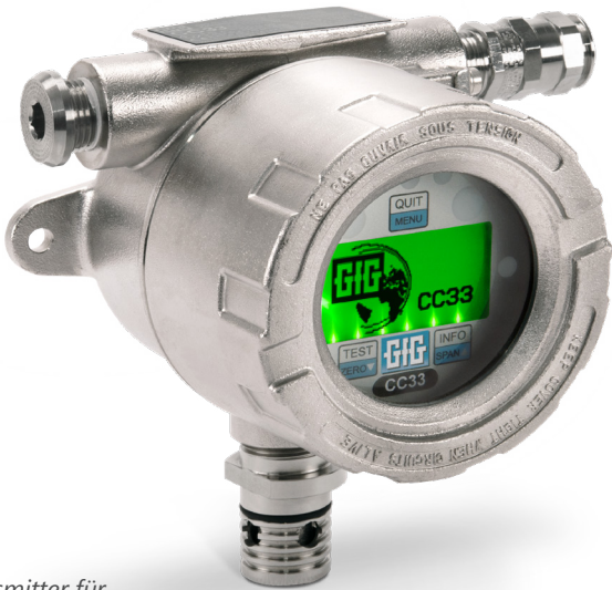
Transmitter für Wärmetönungssensoren, C33

Katalytische UEG-Sensoren erkennen das Gas, indem sie es oxidieren oder „verbrennen“. Sie benötigen die Anwesenheit von Sauerstoff, um Gase zu erkennen. Herkömmliche Wärmetönungssensoren können ein Gas nicht erkennen, wenn die Atmosphäre zu wenig Sauerstoff enthält. In der Regel werden die Messwerte für brennbare Gase in Prozent der unteren Explosionsgrenze (%-UEG) angegeben.