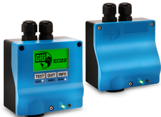
Transmitter für elektrochemische Sensoren, EC22

Sie können sich jederzeit an uns wenden, wenn Sie Fragen dazu haben, wie Sie Ihre Einrichtung oder Anlage am besten vor den Gefahren durch Wasserstoff schützen können.